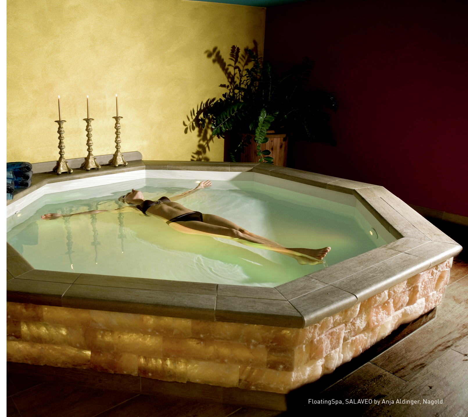
FloatingSpa, SALAVEO by Anja Aldinger, Nagold

Korrosionsbeständigkeit auf besondere Weise gerecht wird. Durch das Ospa-Soleverfahren bleibt die wertvolle Sole erhalten und wird wirtschaftlich aufbereitet. Diese wirksame Technik gewährleistet hygienisch einwandfreie Sole für jeden Badegast.